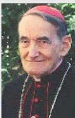
Avery Cardinal Dulles, S.J.

Pravda zostúpi iba na toho, kto ju hľadá, kto v sebe nosí predom ustlané mentálne miesto kde by sa pravda mohla ubytovať. Ortega y Gasset