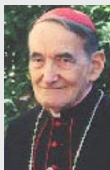
Avery Cardinal Dulles, S.J.

Pravda zostúpi iba na toho, kto ju hľadá, kto v sebe nosí predom ustlané mentálne miesto kde by sa pravda mohla ubytovať. Ortega y Gasset